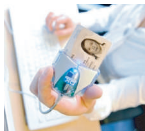
Fotografie: Buletin de identitate electronic estonian, utilizat pentru votul online. [15]

Această metodă de vot permite alegătorilor să voteze de la distanță, din orice loc în care există o conexiune la Internet, fără a fi nevoie să meargă la o secție de votare. Toate fazele procesului electoral sunt online, folosind metode și instrumente de identificare sigure. A fost introdus în mai multe țări, [14] dar în prezent numai Estonia îl utilizează pentru toate tipurile de alegeri: locale, parlamentare și pentru Parlamentul European.