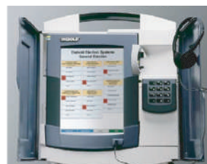
Fotografie: Aparate DRE utilizate în India, SUA și Venezuela. [13]