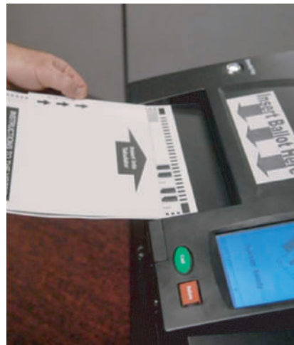
Fotografie: Scanarea optică a buletinelor de vot [10]

Alegătorii merg la secțiile de votare, completează buletinele de vot cu pixul și introduc într-un scanner optic buletinul de vot lizibil electronic. Scannerul analizează opțiunea alegătorului și calculează datele pentru toți alegătorii. Pentru alegători nu este o mare diferență comparativ cu procedurile de vot tradiționale. Pentru lucrătorii electorali, procesul de numărare și înregistrare a voturilor este mult mai simplu și mai rapid. În cazul unor posibile defecțiuni tehnice sau necesității de a renumăra voturile, buletinele de vot pe hârtie sunt păstrate de către autoritățile electorale. Prima țară care a introdus acest sistem a fost SUA, în 1962.